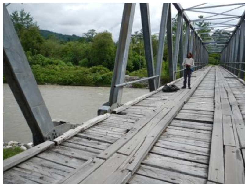
Questo il Sapalewa come si presentava all'altezza del ponte il mese scorso